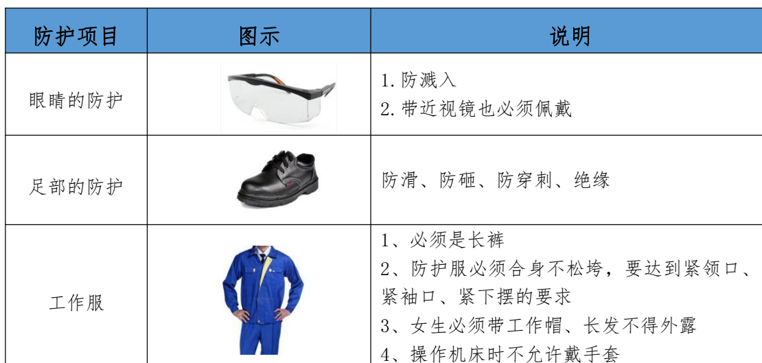
表6 数控车选手必备的防护装备

比赛时，裁判员对违反安全与健康条例、违反操作规程的选手和现象将提出警告并进行纠正。不听警告，不进行纠正的参赛选手会受到不允许进入竞赛现场、停止加工、取消竞赛资格等不同程度的惩罚。