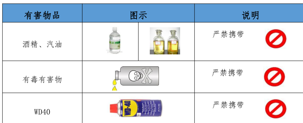
表7 选手禁带的物品